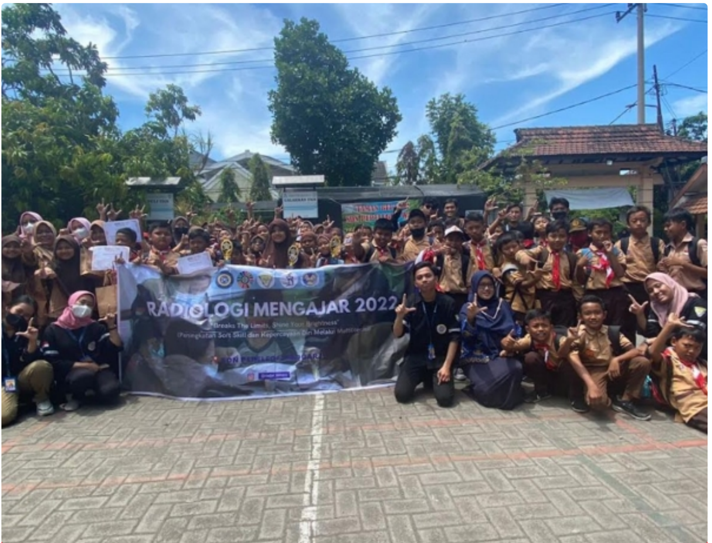
Foto bersama panitia dan siswa SDN Pepelegi 2 Sidoarjo dalam acara Radiologi Mengajar 2022

SURABAYA – Rendahnya minat literasi di Indonesia yang masih minim mendorong Divisi Pengabdian Masyarakat dan Lestari Lingkungan Himpunan Mahasiswa D4 Teknologi Radiologi Pencitraan Fakultas Vokasi (FV) Universitas Airlangga (UNAIR) melaksanakan kegiatan Radiologi Mengajar 2022. Bertempat di SDN Pepelegi 2 Sidoarjo, Radiologi mengajar memberikan wadah bagi anak pada jenjang sekolah dasar dalam membentuk soft skill mereka. Terutama dalam