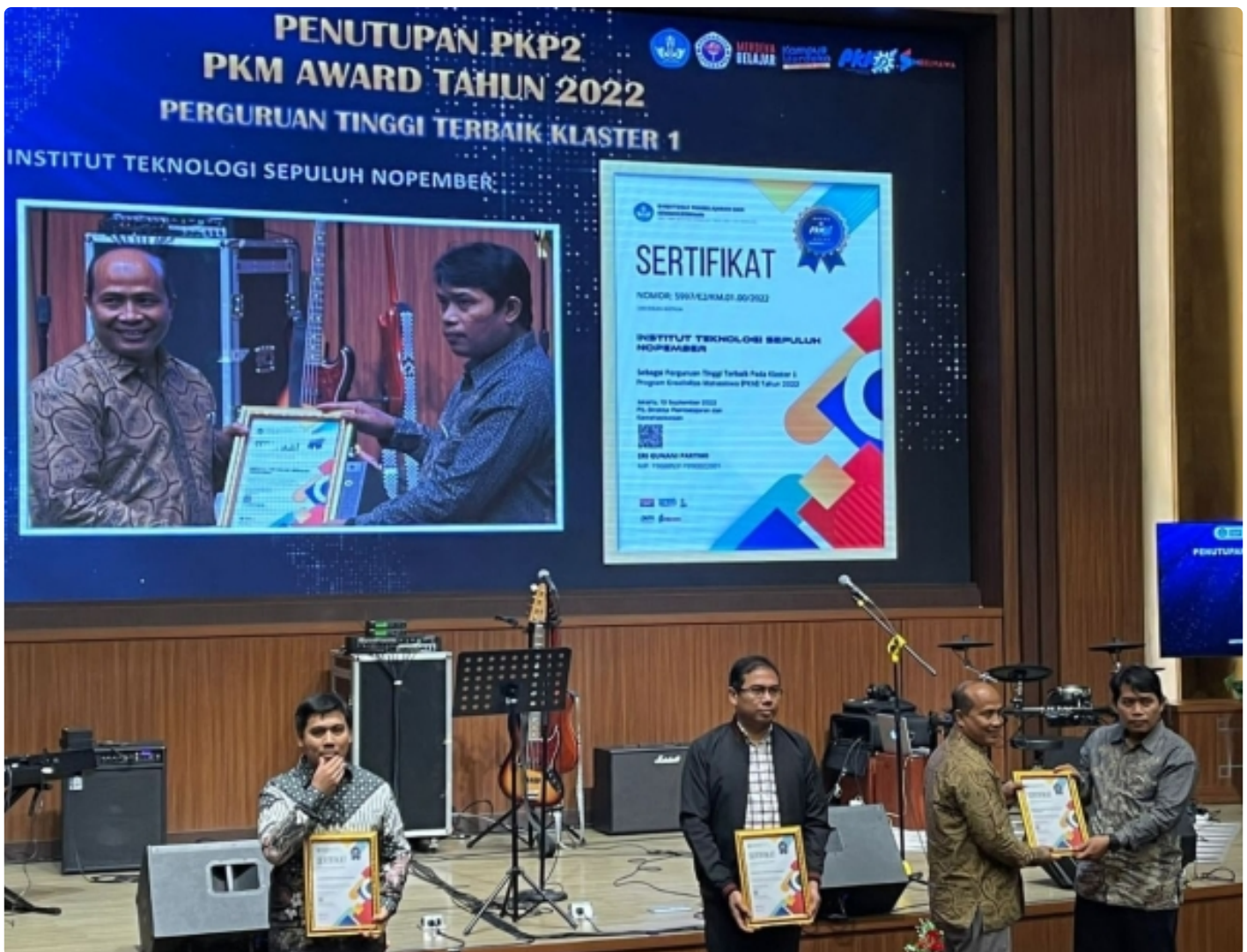
Penobatan ITS sebagai Perguruan Tinggi Terbaik pada Klaster I dalam ajang PKM Award 2022

SURABAYA – Institut Teknologi Sepuluh Nopember (ITS) terus menunjukkan kiprah prestasi membanggakan dalam berbagai ajang baik skala nasional maupun internasional. Kali ini, ITS berhasil meraih penghargaan perguruan tinggi kategori Manajemen Pengelolaan Terbaik secara Nasional pada ajang Program Kreativitas Mahasiswa (PKM) Award 2022.