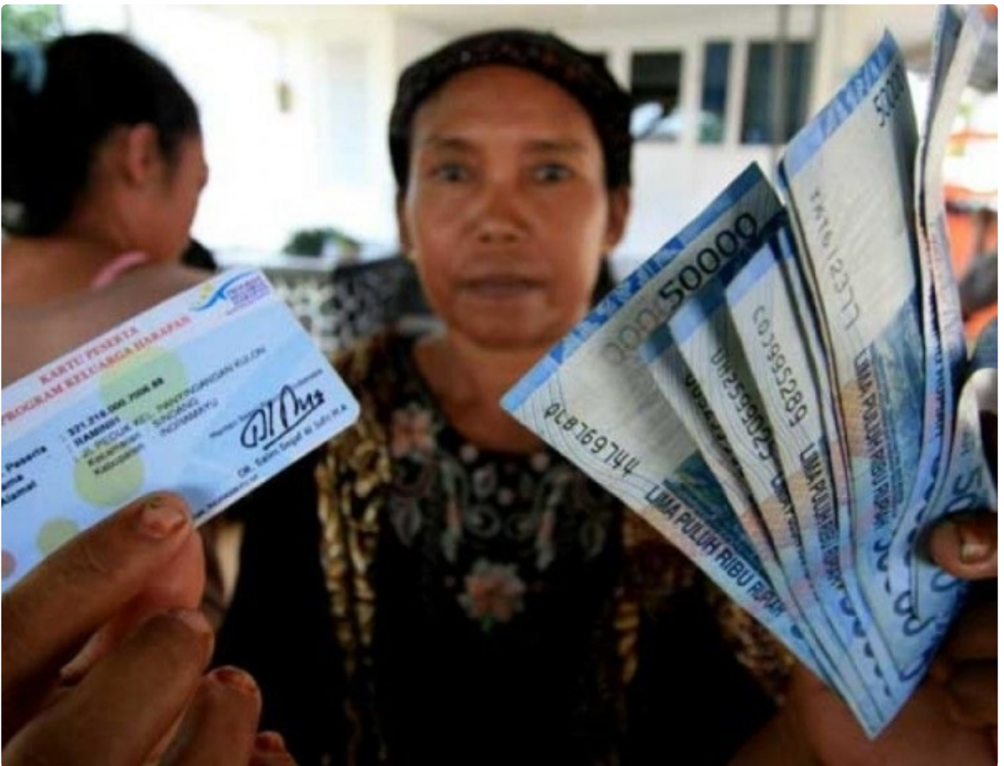
Ilustrasi Pemberian Bantuan Langsung Tunai (BLT).

SURABAYA – Harga bahan bakar minyak (BBM) bersubsidi dan non-subsidi resmi mengalami kenaikan pada Sabtu (3/9). Hal tersebut langsung diumumkan oleh Presiden Joko Widodo di Istana Merdeka, Jakarta. Kenaikan komoditas tersebut memicu gelombang protes yang masif dari berbagai kalangan masyarakat. Demo dan seruan aksi tidak berhenti digelar di berbagai tempat.