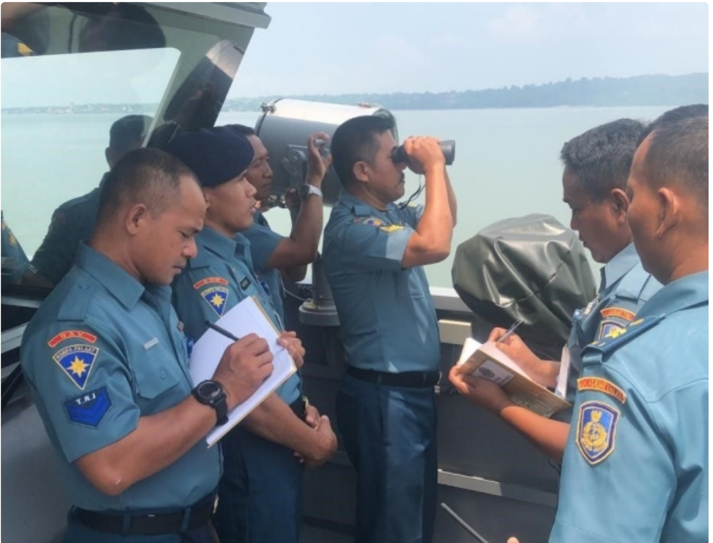
Proses pengujian SFPS di lapangan yang dilaksanakan langsung bersama TNI AL

SURABAYA – Dalam mengemban tugasnya sebagai garda terdepan pertahanan negara, Tentara Nasional Indonesia (TNI) Angkatan Laut (AL) membutuhkan perangkat teknologi yang mumpuni. Namun, ujung tombak kekuatan TNI AL yakni Kapal Perang Republik Indonesia (KRI) masih menggunakan lampu komunikasi dengan sistem manual. Melihat hal ini, mahasiswa Institut Teknologi Sepuluh Nopember (ITS) mengembangkan lampu canggih bernama Automorse.