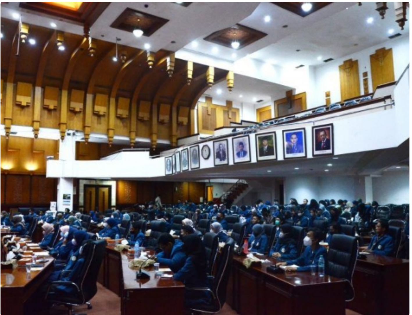
Para peserta Sekolah Kepemimpinan Angkatan 1

SURABAYA – Badan Legislatif Mahasiswa (BLM) Fakultas Ilmu Budaya (FIB) Universitas Airlangga (UNAIR) mengadakan Sekolah Kepemimpinan Angkatan I pada Sabtu (24/9/2022). Kegiatan itu dihadiri 160 peserta.